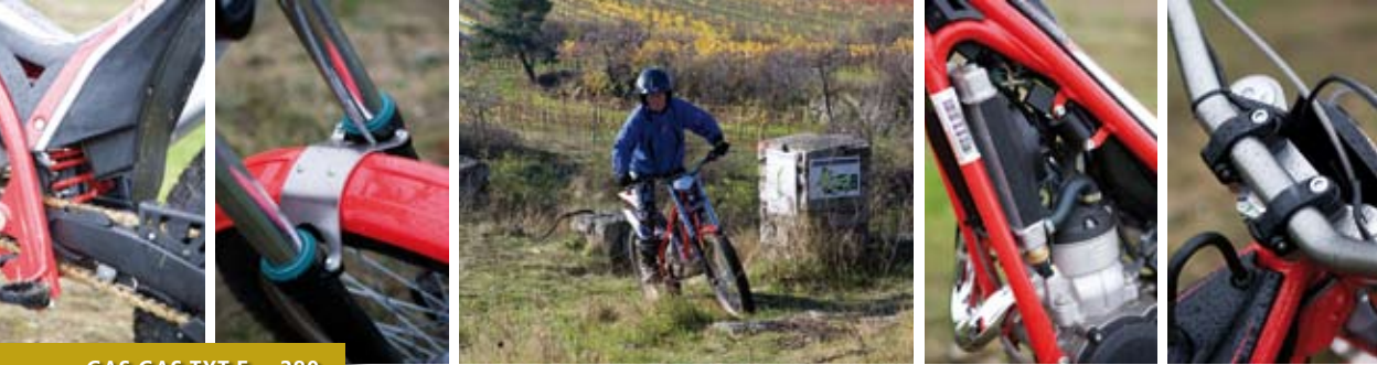
GAS GAS TXT Eco 280

Doch es wäre ja schlimm, wenn das anders wäre. Denn der Rahmen der heutigen Eco basiert auf einem Prototyp, den Adam Raga schon bei