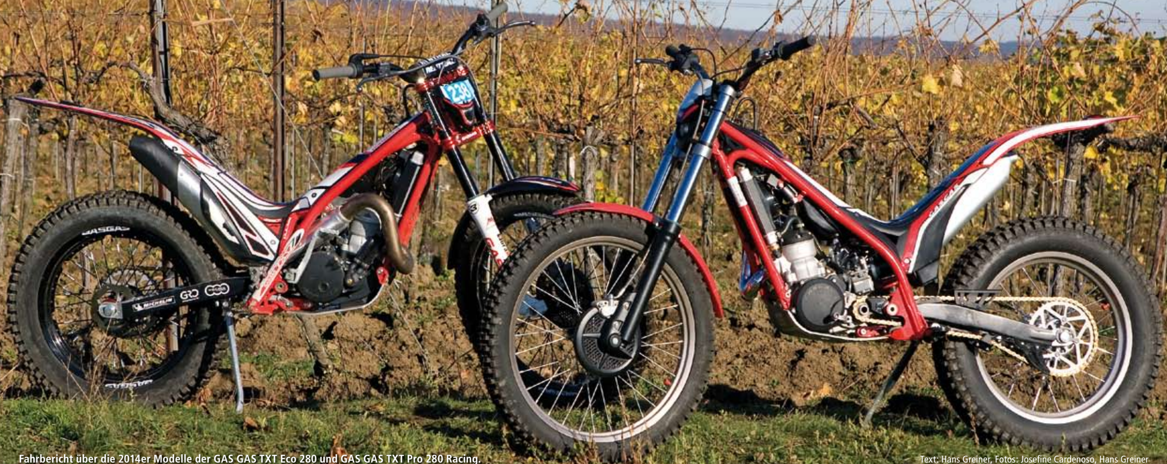
Fahrbericht über die 2014er Modelle der GAS GAS TXT Eco 280 und GAS GAS TXT Pro 280 Racing.

Text: Hans Greiner