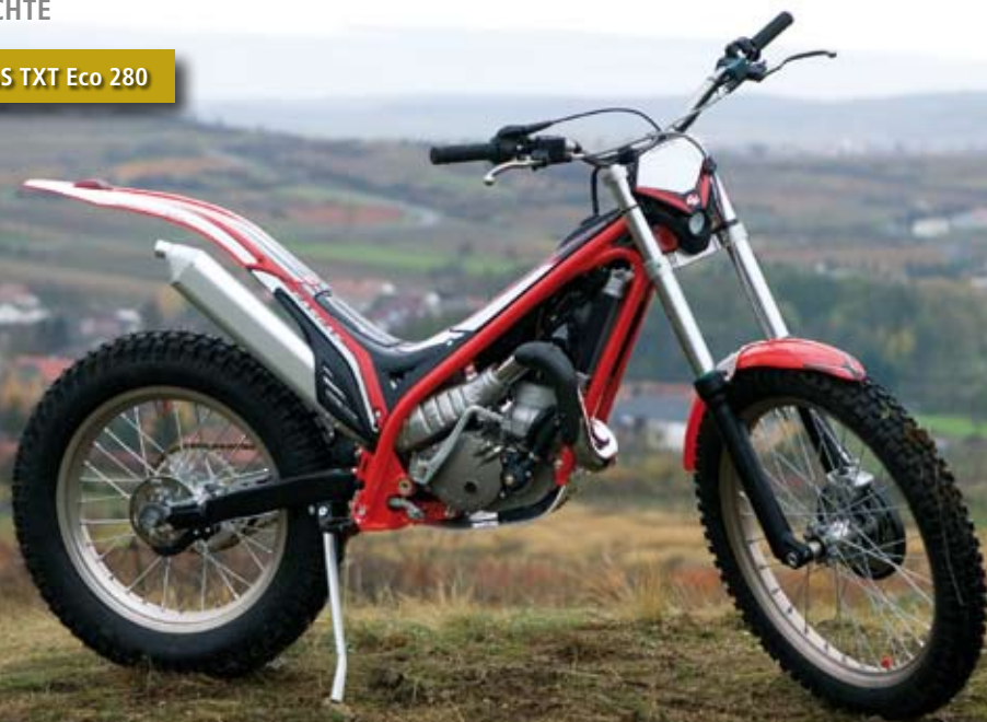
GAS GAS TXT Eco 280