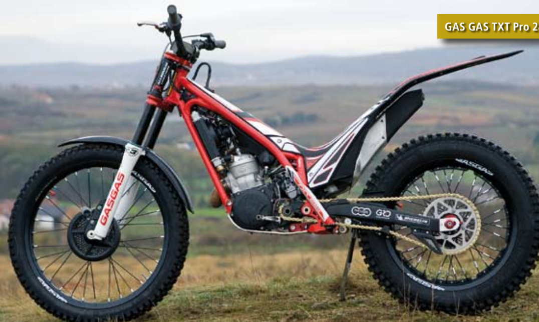
GAS GAS TXT Pro 280 Racing

Besser verdienenden Einsteigern empfehle ich hingegen die Standard-Pro. Sie hat die modernere Rahmengeometrie als die Eco und passt von der Leistungsentfaltung besser für Anfänger als die Racing. Diese wiederum sieht man nicht umsonst oft bei Trial Veranstaltungen. Fortgeschrittenen Trial Fahrern bietet sie für - je nach Hubraumvariante - 600 bis 700 Hundert Euro Mehrpreis gegenüber einer Pro, im Hinblick auf ambitionierte Wettbewerbsleistungen und top Ergebnisse mehr Möglichkeiten. <