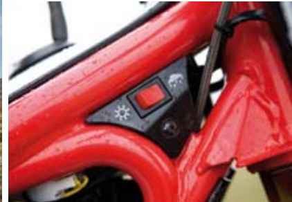
GAS GAS TXT Pro 280 Racing